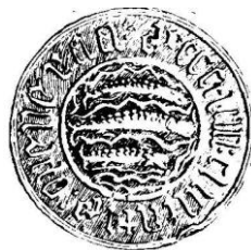
Her gl. byvåben 1421

Plan over Aabenraa. med angivelse af 2-meter højdekurven, der viser, hvorledes bybakken hæver sig mellem Kilen mod øst og engdragene mod vest.